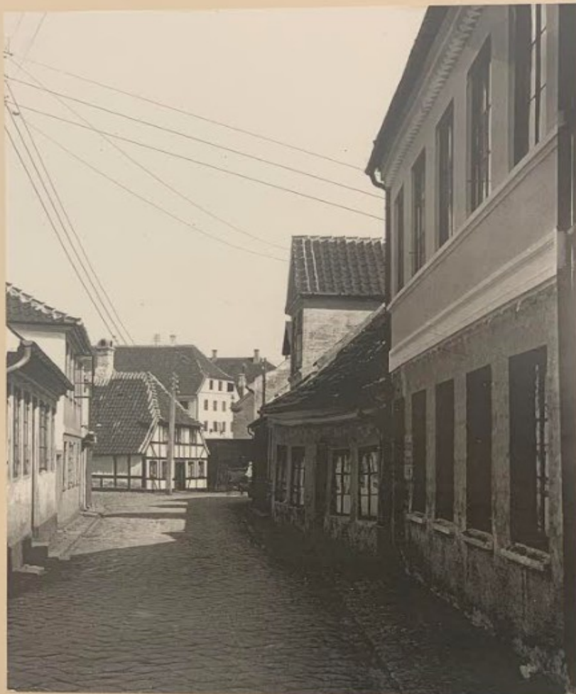
Kullinggade mod Gåsetorvet.

-Lad byen blive stolt, så Skjærbæk kan lægge navn til pladsen foran den Italienske Villa fx Skjærbæk plads.