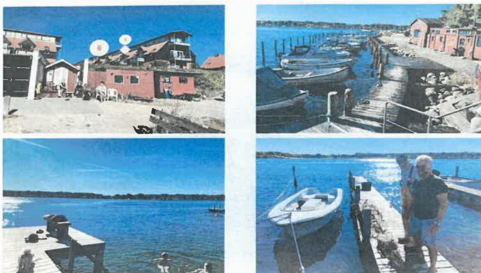
Foto og tekst fra byplanlæggernes oplæg: "Kvaliteter omkring Søndre havn i dag.

"Helges hus" er Ca 90 meter fra grunden, hvor bygherren ønsker at bygge sine massive betonhuse.